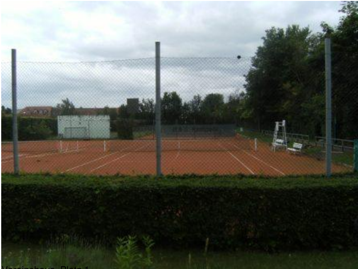
Vereinspark Platz 1