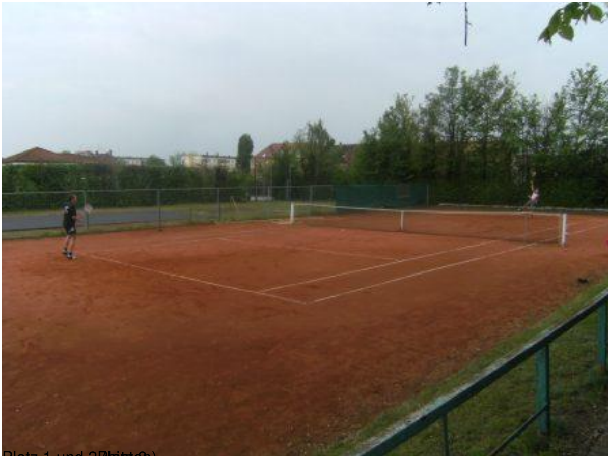
Platz 1 und 2 (Platz 3)